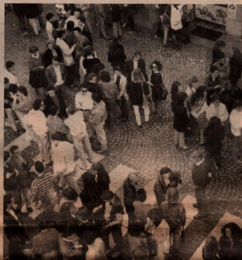
Sgominata nel Salento un'organizzazione di spacciatori

Il blitz è scattato all'alba, ventiquattro persone sono state arrestate. Così ieri mattina gli uomini della Squadra mobile di Lecce hanno sgominato un'organizzazione che importava grossi quantitativi di eroina e cocaina da Bari e poi li smerciava a Lecce ed in tutta la provincia. Un'organizzazione che aveva anche legami con il Brindisino, dov'è stato eseguito uno degli arresti. La droga veniva venduta soprattutto nei pressi di pub, bar, paninoteche. E nelle discoteche, principali luoghi di ritrovo dei giovani salentini. Le indagini della polizia sono andate avanti per quasi un anno e mezzo, tra intercettazioni e controlli.