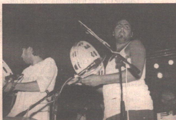
La notte della taranta lo scorso anno a Melpignano

Oggi a Melpignano l'atteso appuntamento con "La notte della taranta". Musicisti salentini si esibiranno nella tradizionale pizzica sotto la prestigiosa direzione del mitico jazzista Joe Zawinul. A Melpignano, come lo scorso anno, sono attese diverse migliaia di persone.