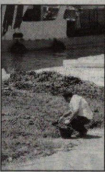
Fango inquinante al Casale