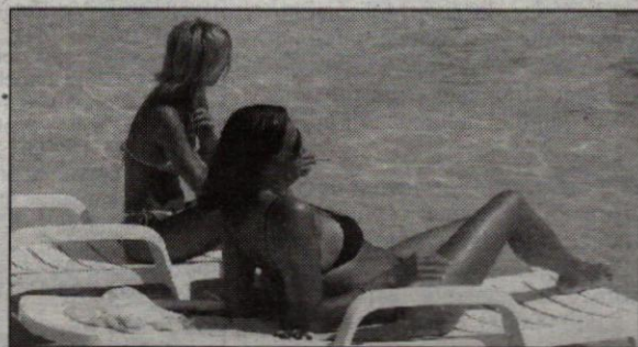
L'estate 2002 è al giro di Boa. Ecco come superare Ferragosto e giungere alla fine delle vacanze senza farsi vincere dallo stress, portando in salvo l'abbronzatura e senza rinunciare al sesso