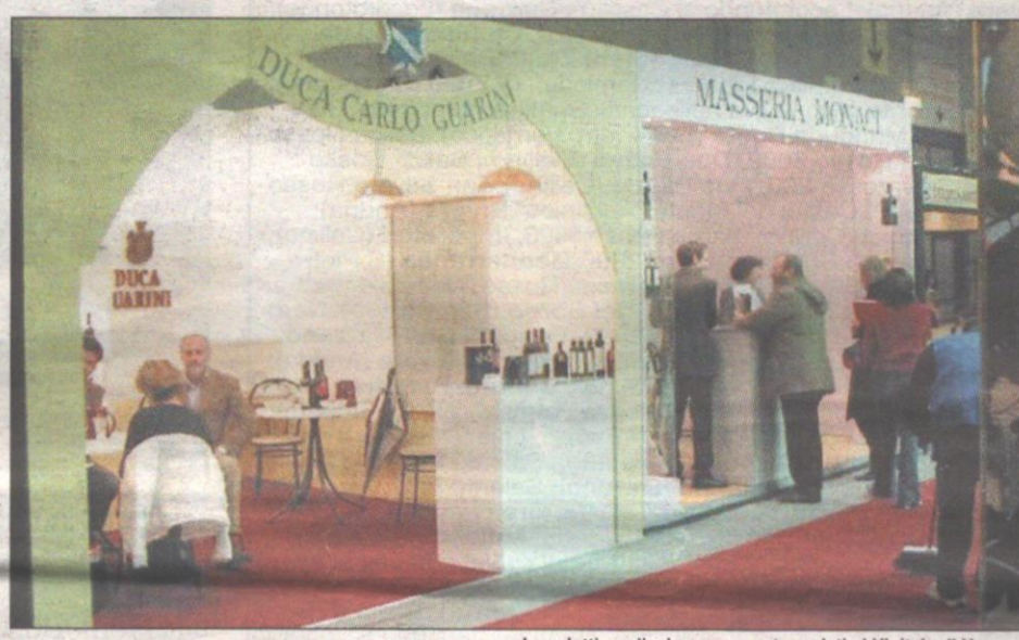
I prodotti pugliesi sempre protagonisti al Vinitaly di Verona

Una grande vetrina internazionale per il vino pugliese la 38.ma edizione di Vinitaly, inaugurata ieri a Verona: un appuntamento di grande importanza per tutto il settore. La Puglia è presente con 104 aziende enologiche e 32 olearie provenienti da tutto il territorio regionale, forte di una produzione di otto milioni di ettolitri di vino, pari al 15% della produzione totale nazionale per 320 milioni di euro.