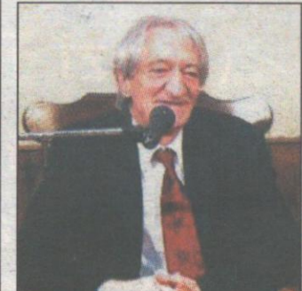
Edoardo Sanguineti sarà domani a San Cesario anche per festeggiare i vent'anni della casa editrice salentina In Cultura

Intervista allo scrittore Sanguineti inaugura la nuova sede dell'editore Manni