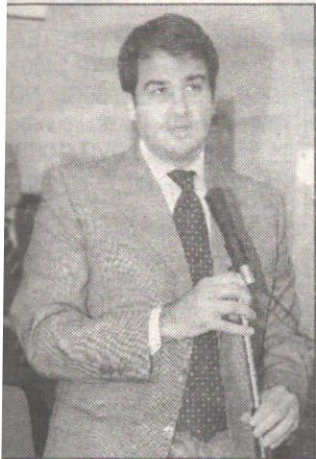
Presidente della Regione, Raffaele Fitto

Regione e vescovi uniscono le forze per rendere fruibili chiese, biblioteche, archivi di proprietà delle diocesi. È il senso dell'Intesa programmatica per la tutela e la valorizzazione dei beni culturali firmata, nel corso della riunione della Conferenza episcopale pugliese, dai presidenti della Regione Raffaele Fitto e della Conferenza episcopale mons. Cosmo Francesco Ruppì. L'intesa, che aveva già ricevuto l'approvazione della Santa Sede, rappresenta un nuovo traguardo nella collaborazione tra Regione e diocesi pugliesi rispetto ai Beni cultu-