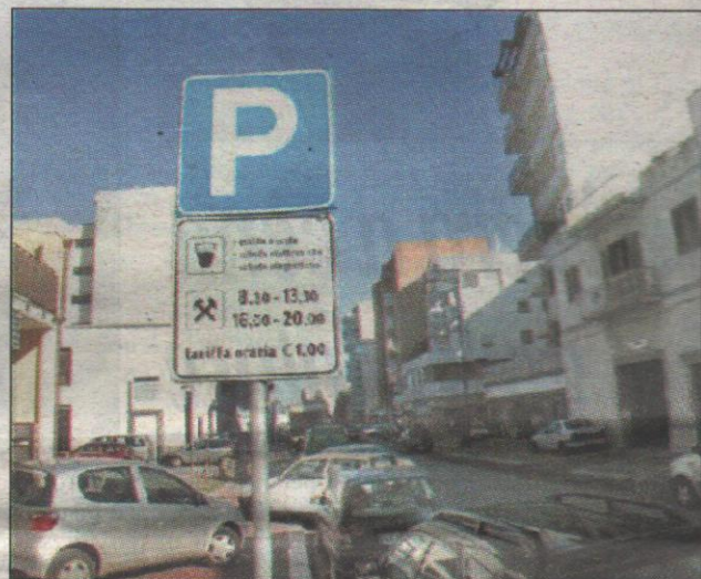
La Uil ha chiesto all'Amministrazione comunale di intervenire presso la Multiservizi al fine di chiedere maggiore rispetto per le esigenze dei cittadini che risiedono o lavorano in centro. «Il nuovo piano parcheggi li penalizza» A pag. 8

La Uil: Multiservizi studi soluzioni più eque «Troppe le strisce blu» i residenti sono infuriati