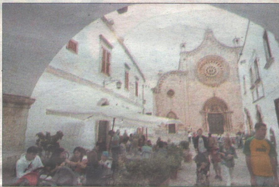
Visitori e turisti a Ostuni