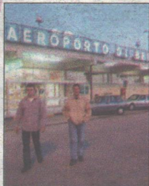
L'aeroporto di Brindisi

Ferrarese: in queste condizioni difficile parlare di sviluppo