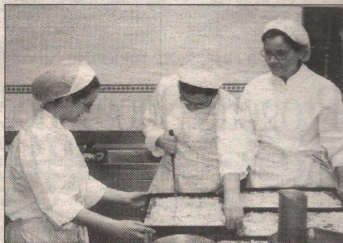
Le ragazze del corso biennale per cuoco

«Una scuola che punta alla preparazione di professioniste nell'accoglienza ma si occupa anche della formazione della persona. E questo fa la differenza. E se non sei più che motivata, non ce la fai, perché la selezione è durissima e la vita all'interno del Centro è improntata sui valori»: così una studentessa descrive il Centro di Formazione Professionale Femminile "Puntasveva". Specializzato nella preparazione delle professioniste dedicate all'accoglienza, questo Centro, con sede a Bari, è gestito dall'Istituto per Centri e Collegi Universitari, Ente Morale riconosciuto dalla Regione Puglia: ha carattere residenziale e offre, in un ambiente familiare e di relazione con le altre studentesse, corsi di formazione professionale all'avanguardia nel settore alberghiero. Le competenze tecniche e professionali sono mirate al conseguimento di un attestato di qualifica della Regione Puglia relativo al profilo professionale di Cuoco. Il piano di studi biennale prevede le materie tradizionali (italiano, storia, mate-