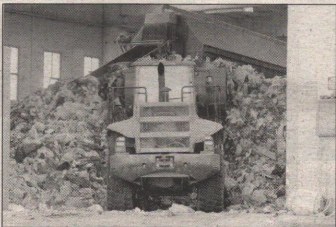
L'interno di una discarica

La Corte dei Conti bacchetta la gestione dell'emergenza rifiuti al Sud ad opera dei vari Commissari straordinari del Governo. E non solo: con la delibera n.5/2007 pubblicata ieri sul sito Internet, la sezione centrale di controllo denuncia "il disallineamento riscontrato dal confronto fra i dati forniti dalle sezioni di tesoreria provinciale e quelli rilevabili dal sistema integrato della Ragioneria generale dello Stato". Così, mentre da una parte la Corte ordina al ministero dell'Economia di depositare entro 30 giorni una relazione contenente l'indicazione analitica delle modalità di afflusso e registrazione dei dati disallineati, dall'altra manda la delibera al Collegio delle Sezioni riunite "affinché, possa trarne deduzioni circa le modalità con le quali le amministrazioni interessate si sono conformate alla vigente disciplina finanziaria e contabile". Modalità che evidentemente, secondo l'organo principale di controllo sulla gestione delle amministrazioni dello Stato, non sono state particolarmente cristalline.