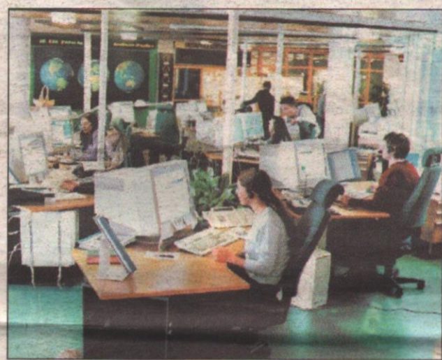
Diecimila precari pugliesi impiegati nei call center sperano nell'assunzione a tempo indeterminato entro il mese di aprile. Le aziende che chiuderanno con il precariato presto avranno notevoli vantaggi fiscali

Diecimila precari pugliesi ora sperano nel posto fisso