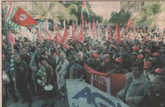
Una manifestazione sindacale