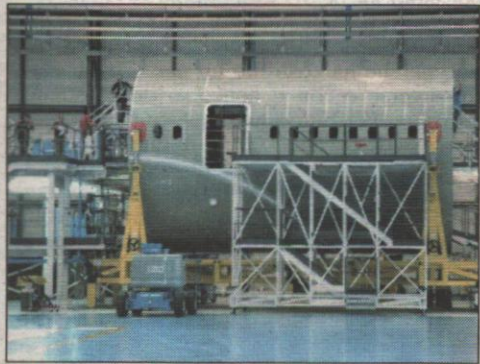
Pronti i fondi per le aziende pugliesi

Finanziamenti alle imprese contro la crisi