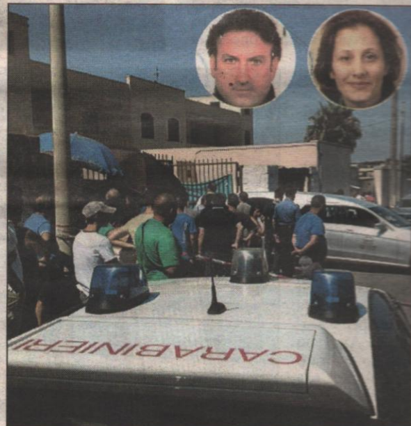
In alto, il killer suicida e la sua vittima Da pag. 2 a pag. 5

Uccide l'ex moglie e si spara alla tempia Ci aveva già provato