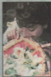
La pizza napoletana

Lista Unesco, 20mila firme per la pizza napoletana