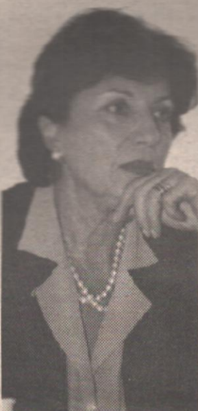
Adriana Poli Bortone