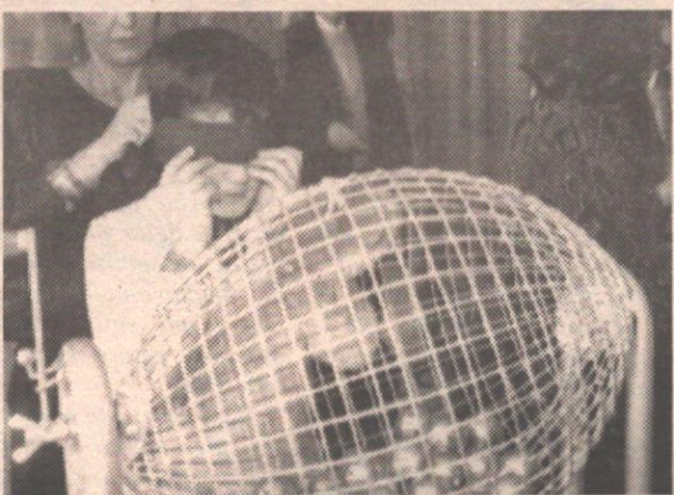
Lotto truccato, l'inchiesta si allarga A pag. 5