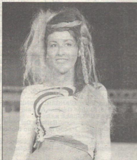
Non riparmi i capelli la pazza moda di questa calda estate

L'estate segna il tripudio della moda e dell'esibizione e si comincia, naturalmente, dalla testa: i capelli quest'anno sono il primo tratto distintivo della personalità; niente regole fisse, dunque, nè modelli a cui ispirarsi, ma grande spazio all'invenzione e all'unicità.