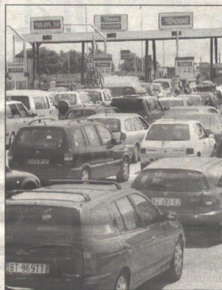
Un caldo torrido accompagnerà il grande esodo verso le località balneari pugliesi. Controlli della Polstrada su tutta la rete viaria per garantire la sicurezza