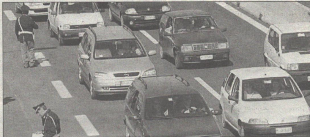
Decine di pattuglie della polizia stradale sono impegnate in controlli di sicurezza lungo la rete viaria pugliese

Autovelex, etilometri e stazioni mobili per sorvegliare il flusso del traffico