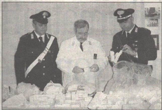
L'inchiesta sulla truffa dei farmaci in Puglia si allarga e scattano altri 22 arresti. Nove le farmacie sequestrate. Sigilli anche alla casa farmaceutica Copernico. In carcere il proprietario, di Torre S. Susanna