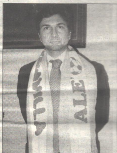
Il presidente Corante (foto) lancia l'allarme: «Non ci sono le condizioni per continuare. Vendo il titolo del Francavilla»