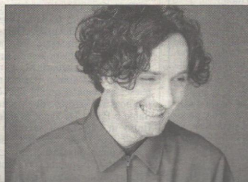
Goran Bregovic ha scelto Otranto per presentare in prima nazionale, domani, il suo "Cuore tollerante". Stasera incontrerà il pubblico