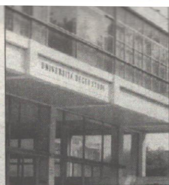
L'università di Lecce

lavoratori e neolaureati delle stesse università novanta borse di mobilità della durata di dodici settimane per il tirocinio presso istituti d'istruzione e formazione professionale e imprese negli altri stati membri dell'Unione Europea. Il bando è consultabile sul sito dell'università di Lecce www.unile.it alla pagina "Programmi europei", da cui sarà possibile anche scaricare il modulo di domanda e il modello di autocertificazione.