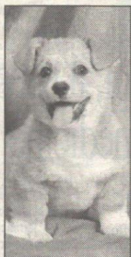
Canile: salta il bando

La Lepa aveva perso la gara d'appalto per la gestione del canile, per un solo centesimo di ribasso. Ma il Tar ha annullato il bando "irregolare". Tutto da rifare.