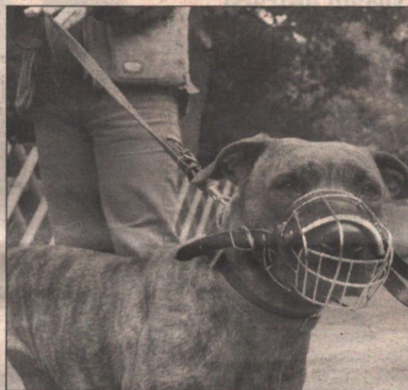
Due a Lecce, due a Galatone, uno a Oria e uno a Taranto: sei pitbull sono stati catturati ieri, mentre un altro è stato trovato morto a Galatone. Sono sempre più numerosi i padroni che li abbandonano

I padroni abbandonano i cani: è polemica Caccia aperta ai pitbull: catturati sei randagi