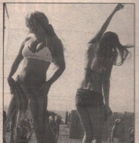
Oggi e domani, feste a go go

Protezione 0 il meglio dell'estate in Puglia Ferragosto, tutti in pista