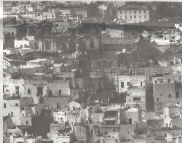
Una veduta di Ostuni

L'ufficio di presidenza de «La Margherita», invita tutte le forze del centrosinistra «non esclusa "L'Italia dei valori", a superare ogni forma di sterile personalismo,