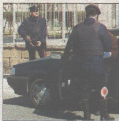
Operazione dei carabinieri