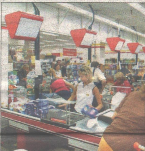
Anche nei supermercati occasioni di lavoro

Natale, la corsa agli acquisti e i negozi presi d'assalto (nonostante la crisi economica) portano numerose occasioni di lavoro, sia pure temporaneo. Si tratta, per lo più, di offerte d'occupazione per commessi e commesse nei vari negozi, ma anche per vetrinisti - molto richiesti - e per impiegati, banconisti e addetti di vario genere nei supermercati e negli iperstore. Opportunità di vario genere, e con impegno e compenso diverso.