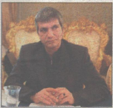
Toccherà a Prodi dire la parola decisiva sulla scelta del candidato presidente del centrosinistra in Puglia. In lizza Vendola e Boccia