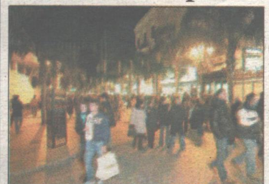
Insieme alle attività programmate dall'assessore agli Spettacoli, anche il delegato al commercio ha previsto iniziative per attirare acquirenti in centro. Controlli sui prezzi Alle pagg. 8 e 9