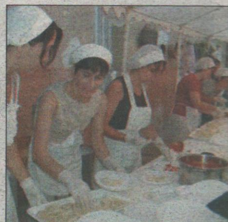
Weekend di sagre nel Salento

Ritorna oggi l'inserito Dolcevita: otto pagine con tutti gli appuntamenti più importanti del week-end a Lecce, Brindisi e Taranto. E poi tante idee per tutti i gusti. A cominciare da quelle gastronomiche, dalle sagre alle rassegne.