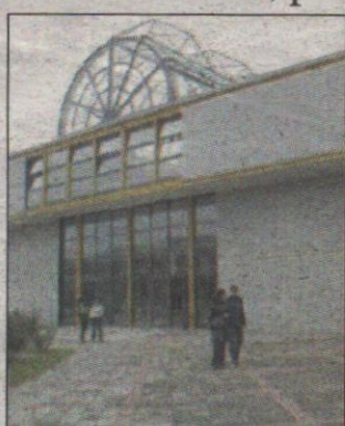
La sede della nuova facoltà

Scienze sociali, politiche e del territorio: ora si parte