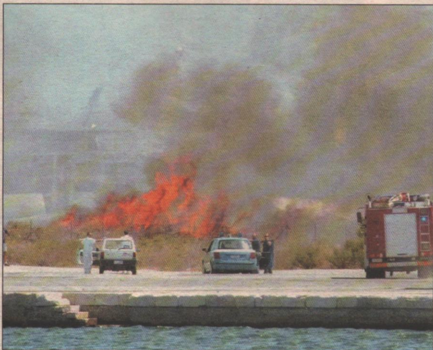
L'intervento dei vigili del fuoco per spegnere l'incendio sviluppatosi ieri mattina nell'area portuale

Gargano, polemiche sui ritardi Dopo il disastro la Procura indaga