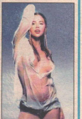
Estate, si scopre la bellezza

Protezione zero Tempo di mare tra ricette, sagre e musica jazz