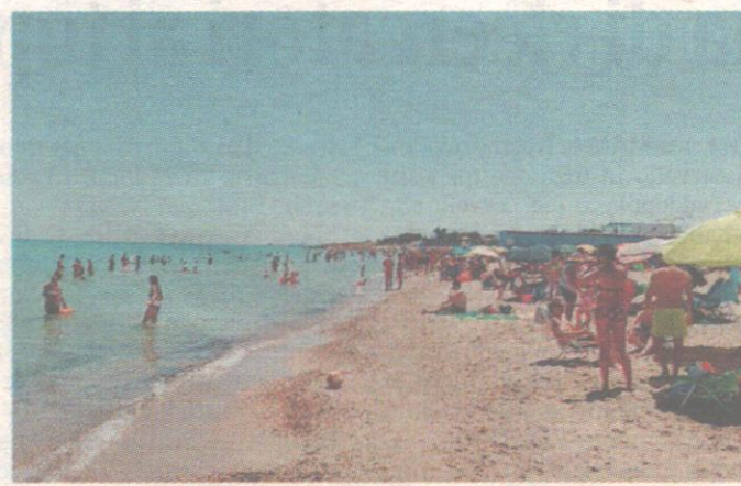
SPIAGGE PIENE I tanti bagnanti presenti ieri sul litorale brindisino in cerca di refrigerio per la grande calura